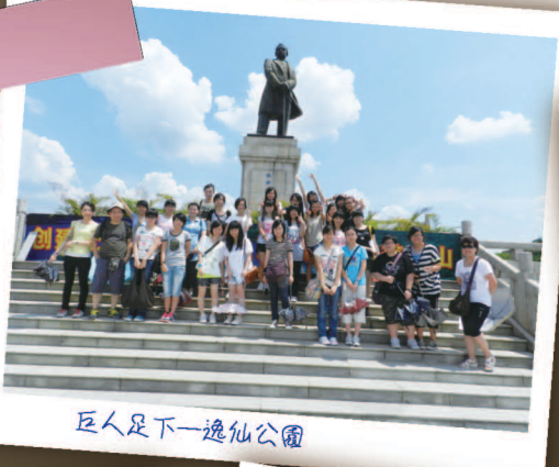
巨人足下—逸仙公園