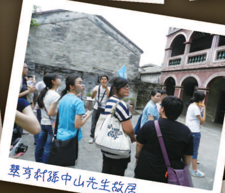
翠亨村孫中山先生故居