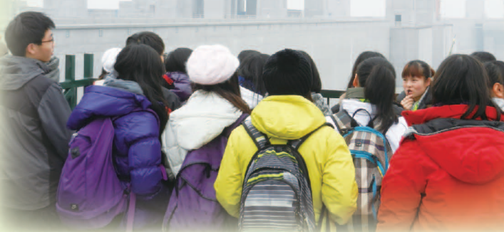
霧中的三峽水壩工程