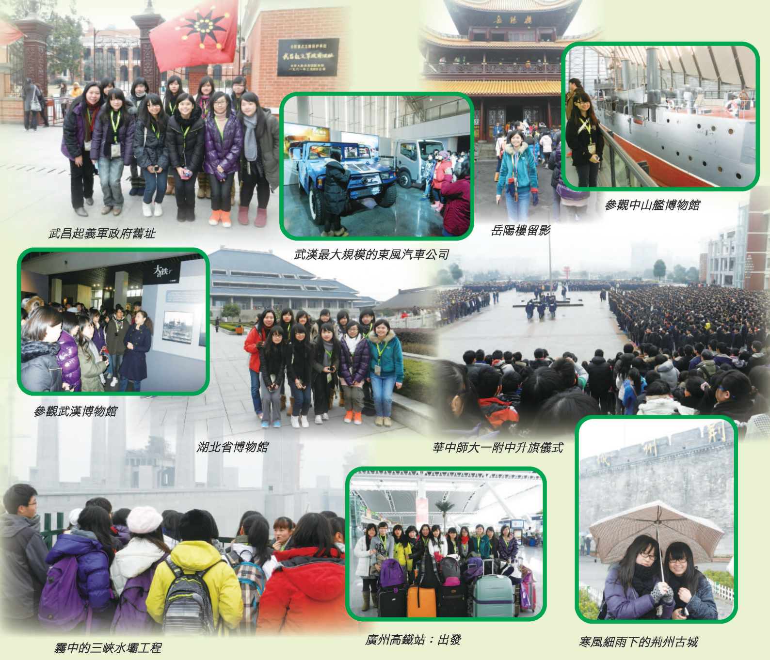
武昌起義軍政府舊址