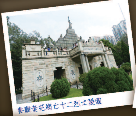
參觀黃花崗七十二烈士陵園