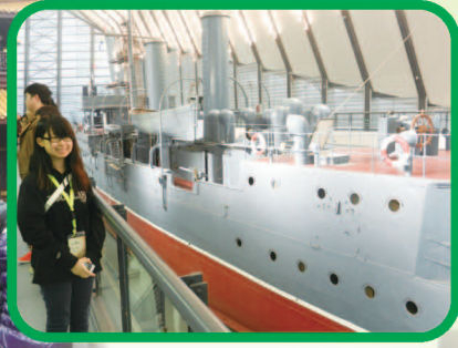
參觀中山艦博物館