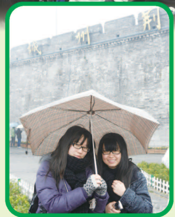
寒風細雨下的荊州古城