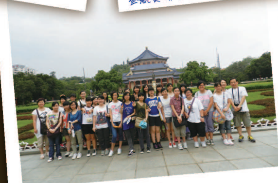
中山先生紀念公園