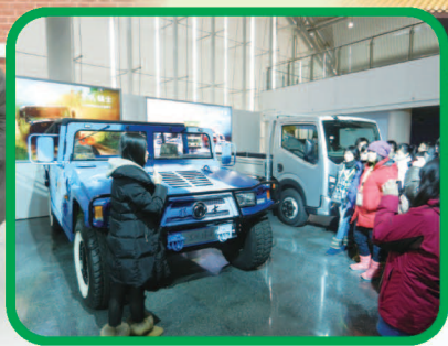
武漢最大規模的東風汽車公司