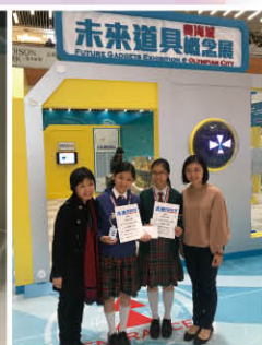
▲ 概念展讓人大開眼界