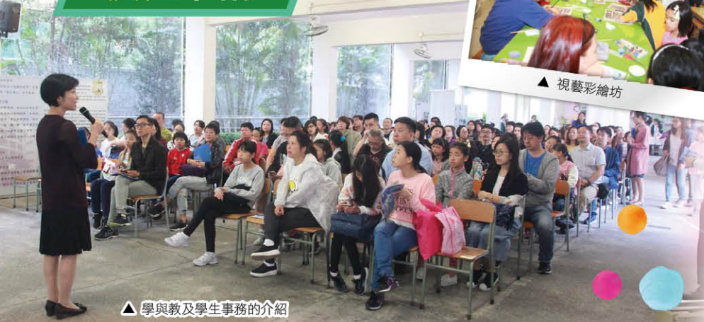
▲ 學與教及學生事務的介紹