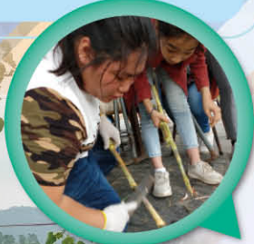
▶ 了解農夫日常工作

本校參加了由香港浸會大學生物資源與農業研究所與香港有機資源中心舉辦的「有機大使培訓計劃」，讓學生了解現時本地有機漁農業的發展，更深入認識有機耕種對環境及社會的價值，以多角度去探討備受社會關注的有機綠色議題，從中實踐有機耕種及綠色生活。活動內容包括有機耕種講座、由本地有機農夫到學校農圃指導的有機農耕工作坊、有機農場實習，讓學生親身到本地有機農場體驗有機耕作，並了解農夫的日常工作及有機農場的操作。