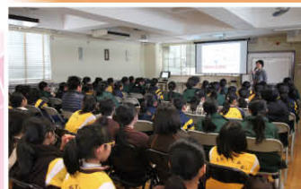
▲ 留心聆聽學校資訊