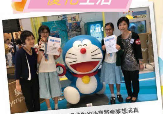
▲ 未來多啦A夢百貨袋內的法寶將會夢想成真