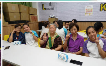
▲ 學生與長者一同觀賞作品