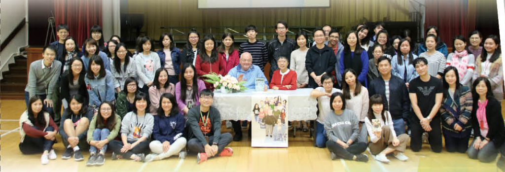
▼ 全體老師欣賞甘神父的電影，並對他在香港的工作有更多的了解。

來作《甘浩望巡禮之年》電影欣賞，透過甘神父為香港弱勢社群服務四十多年的經歷分享，讓我們同為建立一個平等的社會而繼續努力。