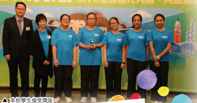
▲ 本校學生接受獎座