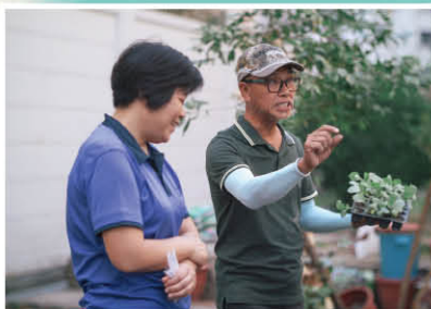
▲ 本地有機農夫到校主持有機農耕工作坊

生活中，我們每天都會吃蔬菜，但蔬菜生長的過程要注意甚麼？不是只要有陽光、水、肥料就可以了嗎？原來，當中還有很多學問，例如：有些菜不能多曬，水也不能澆太多，多久要施肥等等，這次計劃不但讓我們體驗農夫的日常工作 and 了解不同農作物的生長特性以及種植技巧，同時也提升書本以外的環保知識，獲益匪淺。