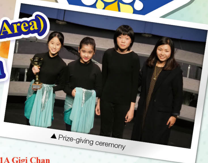
▲ Prize-giving ceremony