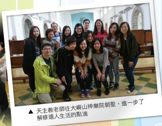
▲ 天主教老師往大嶼山神樂院朝聖，進一步了解修道人生活的點滴