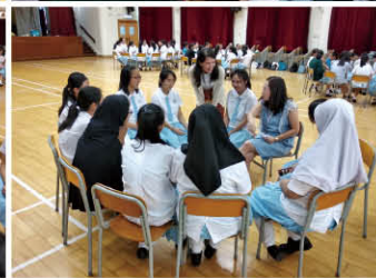
▲ 學生分享在不同活動中的得着和反思