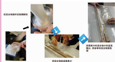
▲ 以蛋殼製作的筷子終於面世了