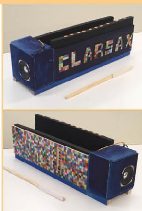
▲ Clarsax 數碼樂器創作意念