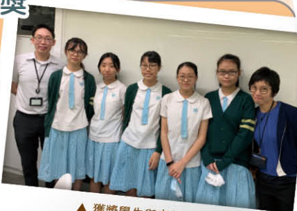
▲ 獲獎學生與老師的合影