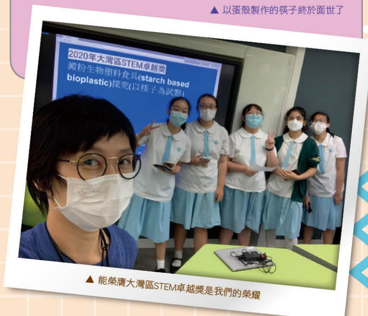
▲ 能榮膺大灣區STEM卓越獎是我們的榮耀