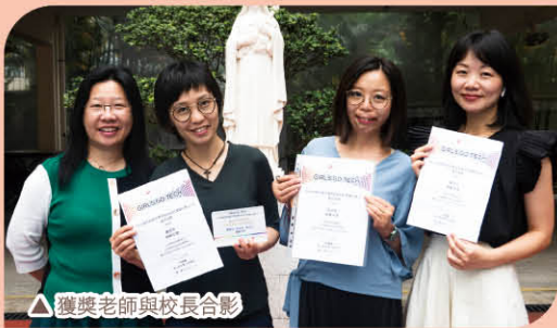
▲ 獲獎老師與校長合影

本校因應女校學生喜歡藝術創作的特點，融合視覺藝術科(A)和宗教(R)元素，把 STEM 進一步擴展為 STREAM，制訂出一套在課程設計、規劃及實踐上適合女生的跨學科學習課程。此次由科學科、企業會計與財務概論科及視藝科以本校女學生的特質設計跨學科的科本教案，以「製作有機護膚品」為主題，發揮創意，製作個人化的天然有機產品，同時建立品牌，體驗企業家的創業精神，藉此提升學生學習興趣，並實踐天主教五大教育核心價值中的「愛德」，關愛別人和珍惜資源。有關教案能提升她們對數理科的興趣及融會貫通各科知識，並獲婦女基金會舉辦的 Girls Go Tech 計劃「STEM 教育與電子學習教案設計獎勵計劃 2019」的STEM 傑出科目教案(初中組)銅獎。