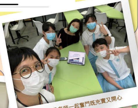
▲ 與同學及老師一起奮鬥既充實又開心